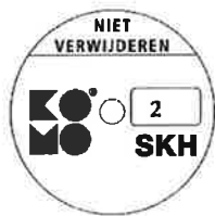
geschikt voor weerstandsklasse 2